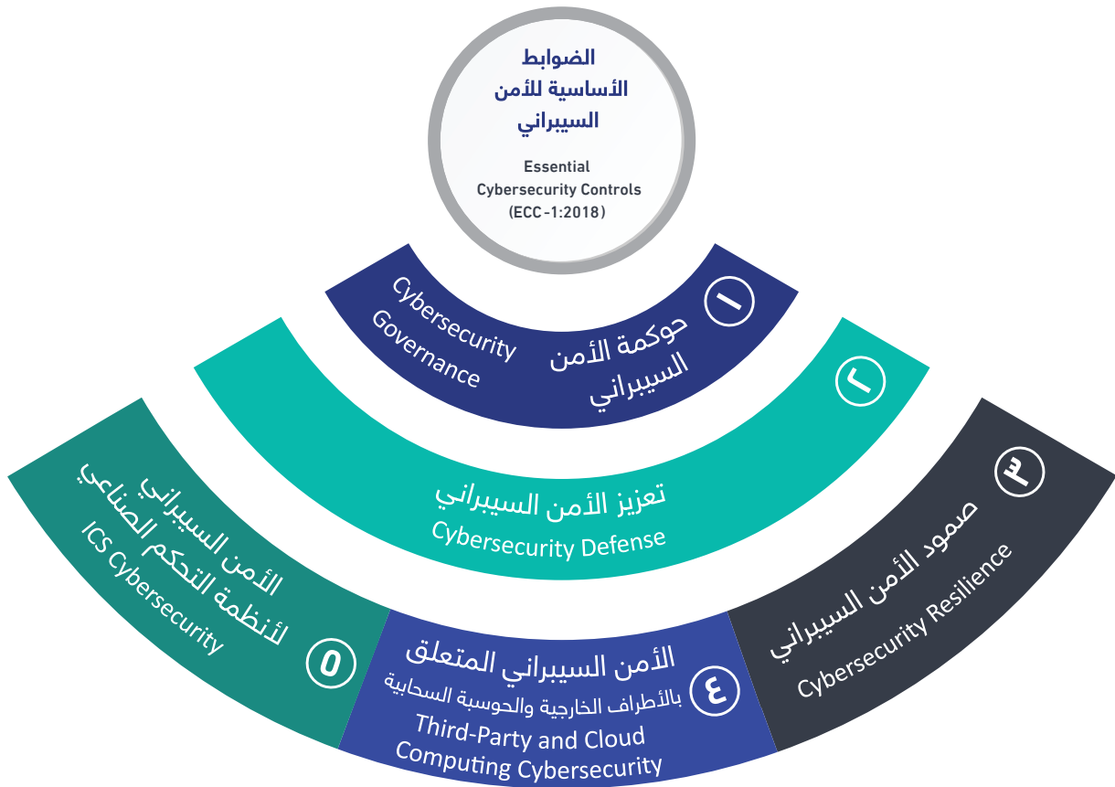
شكل ١: المكونات الأساسية للضوابط

يوضح الشكل ١ أدناه المكونات الأساسية للضوابط.